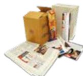
CARTA E CARTONE