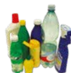
IMBALLAGGI IN PLASTICA