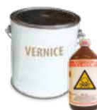
VERNICI, INCHIOSTRI ACIDI E PESTICIDI